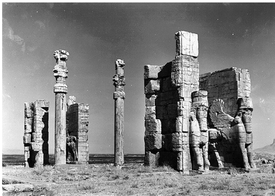
آرامگاه داریوش بزرگ نقش رستم شیراز عملیات کاوش دانشگاه شیکاگو ۱۳۱۸ ش ۱۹۳۹ م