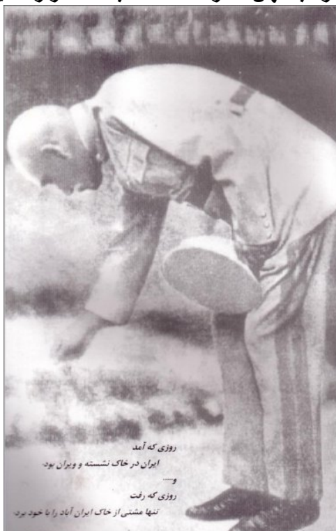
روزی که آمد ایران در خاک نشسته و ویران بود و روزی که رفت تنها مثنی از خاک ایران آباد را تا خود برد

چو انبوه گشتند بر پیشگاه بخواهم که بینم سراسر زمین همه بوم ایران سراسر بگشت به پیمود این بوم ایران بر اسب بسی شهر دیدند از ایران خراب همه خسته از رنج افراسیاب کشاووز گریان و ناشاد بود هر آن بوم و بر کان نه آباد بود از آنجا سوی شهر دیگر شدی هر آنجا که ویران بد آباد کرد درم داد و آباد کردش بگنج بگسترد گردد جهان داد را