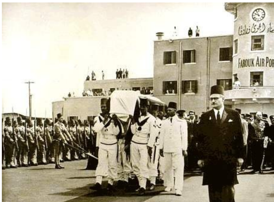
مراسم تدفین رضاه شاه کبیر در مصر