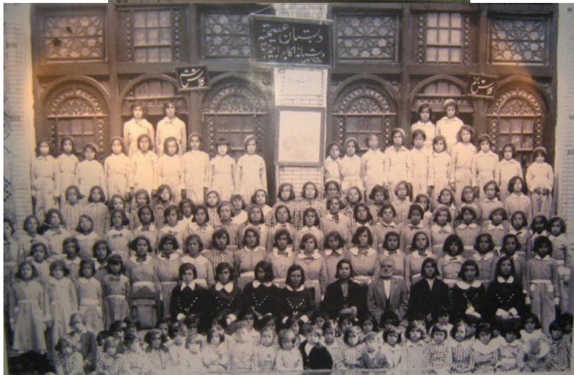
یک مدرسه دخترانه ۱۳۰۴ ش

تلاش بسیار برای استقلال اقتصادی و سیاسی کشور که برترین و عالیترین هدف ایرانیان و سران صدر مشروطیت بود. اخراج مستشاران نظامی و اقتصادی انگلستان و لغو قراردادهای ننگین نفتی با انگلستان