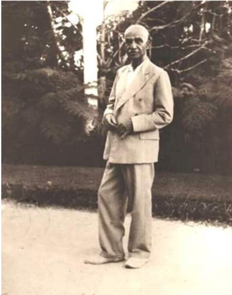
جسم خسته و ناتوان رضاشاه بزرگ پس از توطئه های انگلستان در تبعید (آفریقا)

هر ایرانی آگاهی با دیدن این چهره خسته و ناتوان از مردی که یک تنه ایران ویران شده از قاجار را تحویل گرفته بود و در کمتر از ۱۶ سال آن را در حد یک کشور قابل قبول و با چشم انداز آینده ای بزرگ تحویل آیندگان داد به یاد این سخن فردوسی بزرگ می افتد: