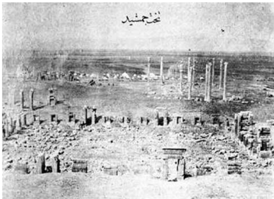
ویرانه های تخت جمشید تا پیش از به روی کار آمدن رضاشاه پهلوی

را در دادگاه‌ها محاکمه کند. اتباع این کشورها در ایران آزادی کامل دارند و هرگونه خلاف و جرم و جنایتی را فقط باید در کشور خود پاسخ بدهند. رضا شاه این امر ننگین را به پایان رساند.