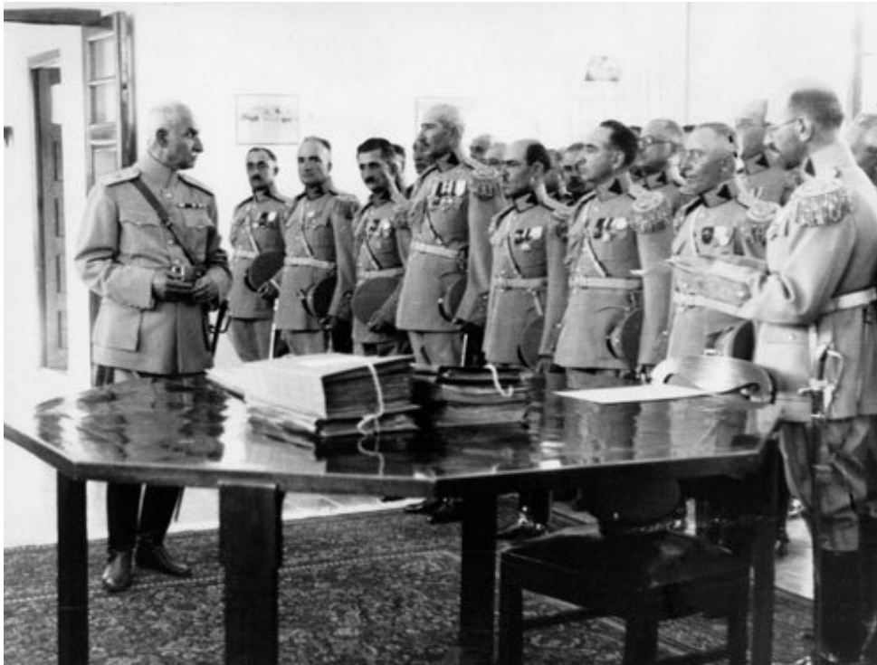
فرماندهان ارتش نوساخته رضا شاه بزرگ