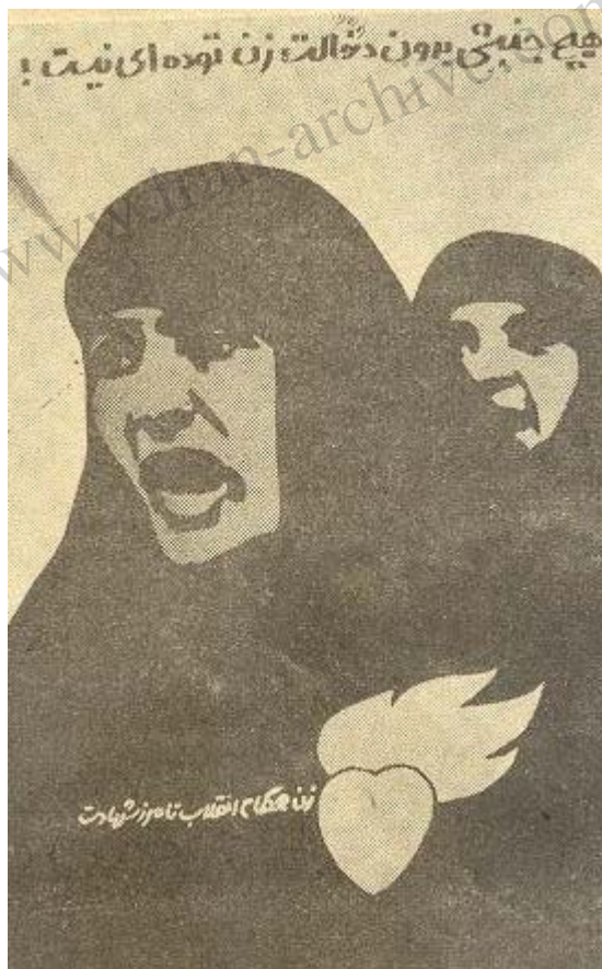
پوستر حزب بمناسبت روز جهانی «زن»!!

امام خمینی از جمله گفتند: ..... ساده اندیشی است که ما گمان کنیم که فقط تخصص میزان است و علم میزان است . علمی الهی هم میزان نیست ، علم توحید هم میزان نیست ، علم فقه هم و فلسفه هم میزان نیست مردم شماره ۴۱۵، شنبه ۲۰ دیماه ۱۳۵۹