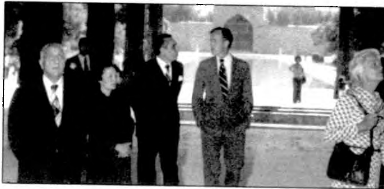
در سفر جورج بوش پدر به ایران، اردیبهشت ۱۳۵۶ در جهلستون اصفهان