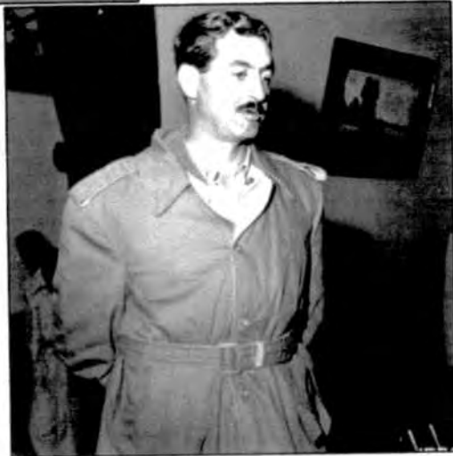
در ۳۱ مرداد ۱۳۴۹ در عراق ترور شد