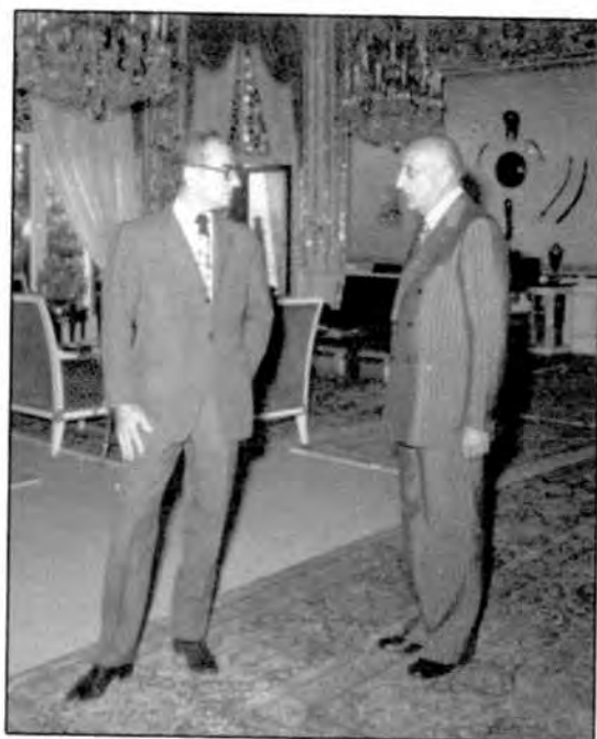
روزهای شرفیابی و ادای احترام به محمدرضا شاه پهلوی