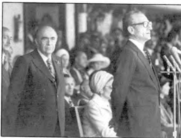
محمدرضا شاه پهلوی، امیر عباس هویدا