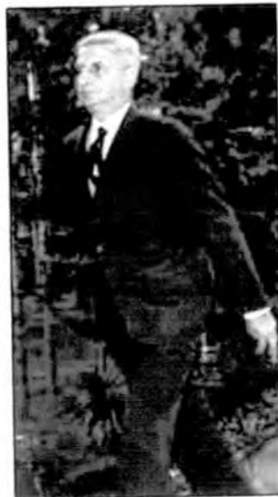
در ۱۲ فروردین ۱۳۵۸ به حکم دادگاه انقلاب، تیرباران شد