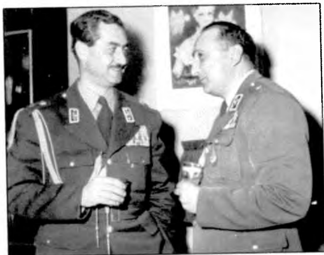
نعمت‌الله نصیری - سومین رئیس ساواک از ۱۳۴۲ - ۱۳۵۷