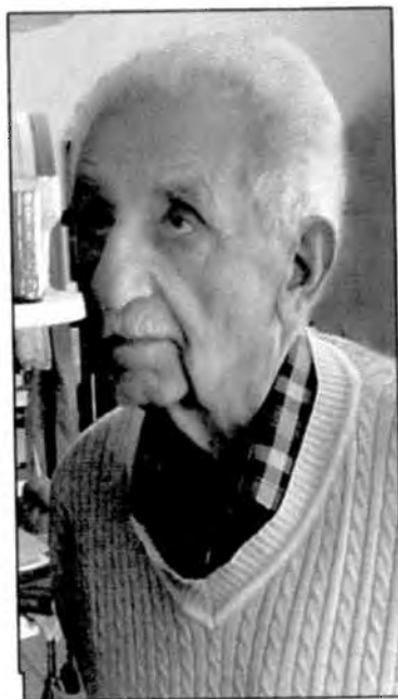
دکتر مجتبیٰ پاشانی