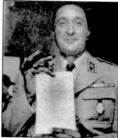
در حال نشان دادن حکم برکناری مصدق السلطنه (که در ۲۵ مرداد ۱۳۳۲ اعلام شد)