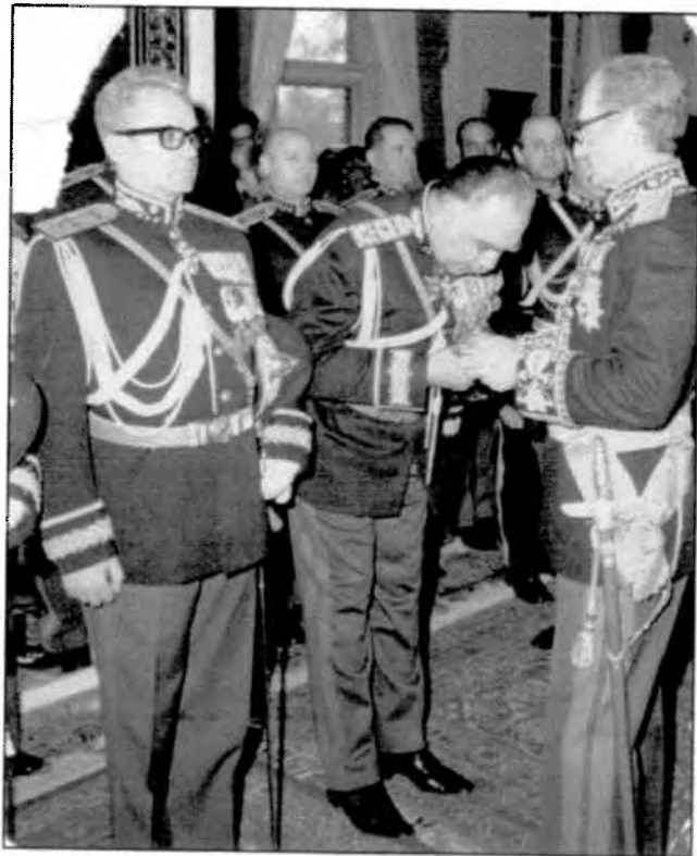
شاه، جنگیز وشمگیر، مقدم