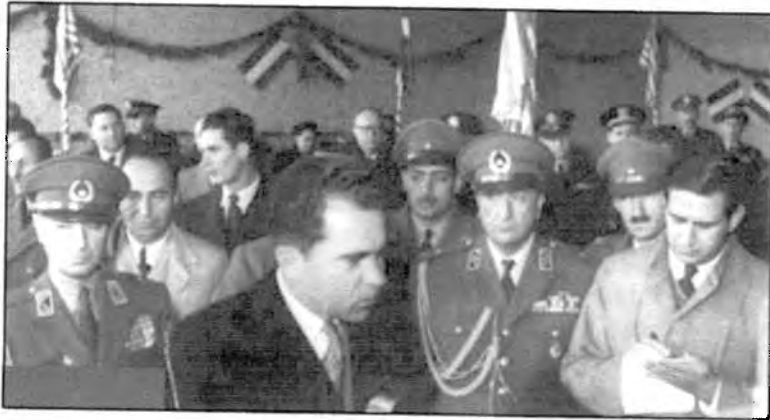
مصاحبه ریچارد نیکسون معاون رئیس جمهور امریکا، با خبرنگاران - تهران ۱۳۳۲/۹/۱۸ ۱. شاپور اردشیر (جی ریپورتر) ۲. نعمت‌الله نصیری ۳. ریچارد نیکسون ۴. ابراهیم مدرسی ۵. مهدیقلی علوی مقدم