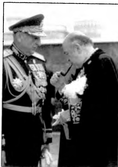
امیر عباس هویدا، نعمت‌الله نصیری