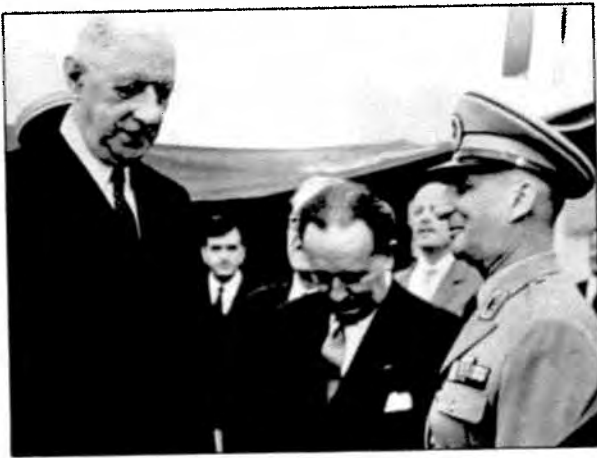
پاکروان، ژنرال دوگل - فرودگاه مهر آباد