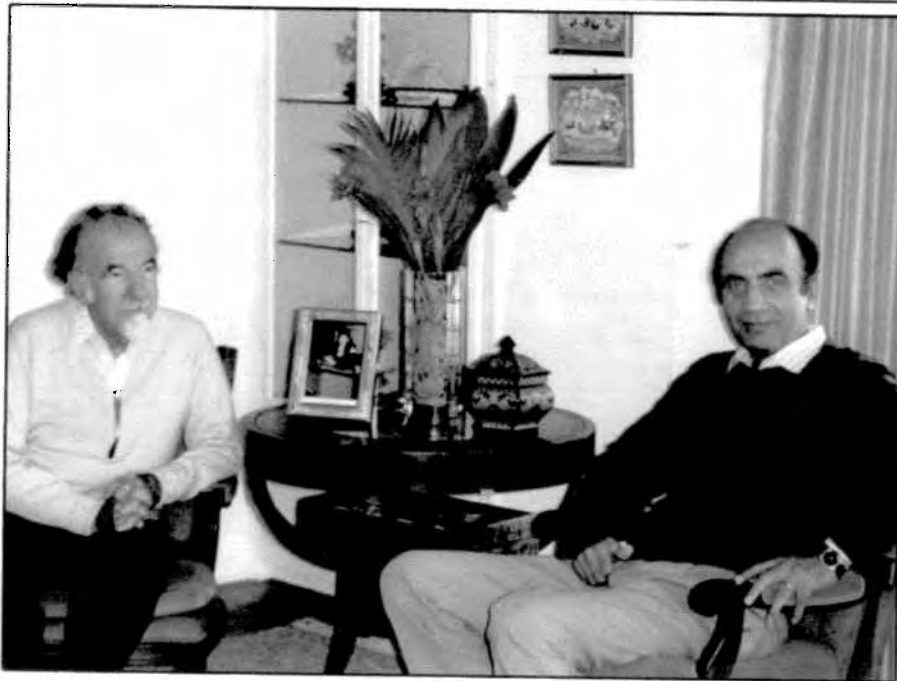
با فریدون هویدا سال ۲۰۰۰