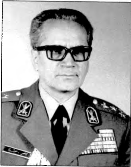
ناصر مقدم، آخرین رئیس ساواک، ۱۳۵۷ که در ۲۲ فروردین ۱۳۵۸ اعدام شد.