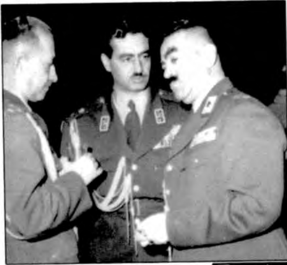
نادر با تمناقلیچ (رئیس ستاد ارتش)، تیمور بختیار (فرماندار نظامی تهران)، عبدالله هدایت (وزیر جنگ)