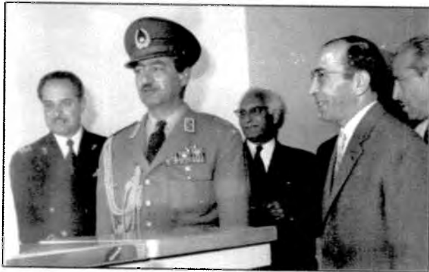
تیمور بختیار - رئیس اول ساواک از ۱۳۳۶ تا ۱۳۴۰