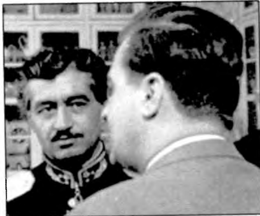
مراسم رسمی سلام در کاخ گلستان