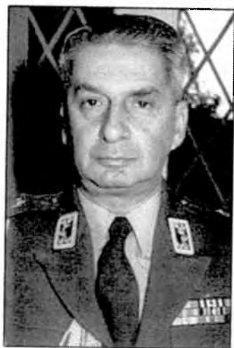
حسن پاکروان - دومین رئیس ساواک از ۱۳۴۰ تا ۱۳۴۲