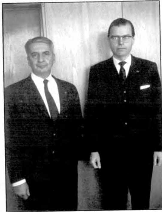
پاکروان و وزیر خارجه آلمان غربی ۱۹۶۵ - Von Hase