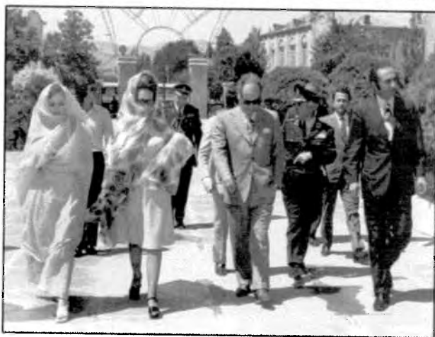
پرویز تابتی و سپهبد جعفرقلی مستوفی صدر رئیس شهربانی در سفر به مشهد