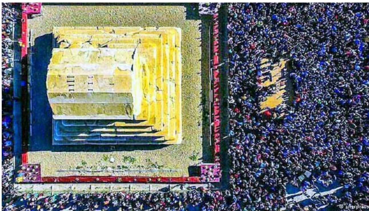
روایت تصویری از استقبال بی‌سابقه ایرانیان از مراسم بزرگداشت کوروش روی یکی از ستون‌های پاسارگاد این عبارت به سه زبان پارسی باستان، عیلامی و بابلی کنده‌کاری شده است: «من کوروش هستم، شاه هخامنشی».