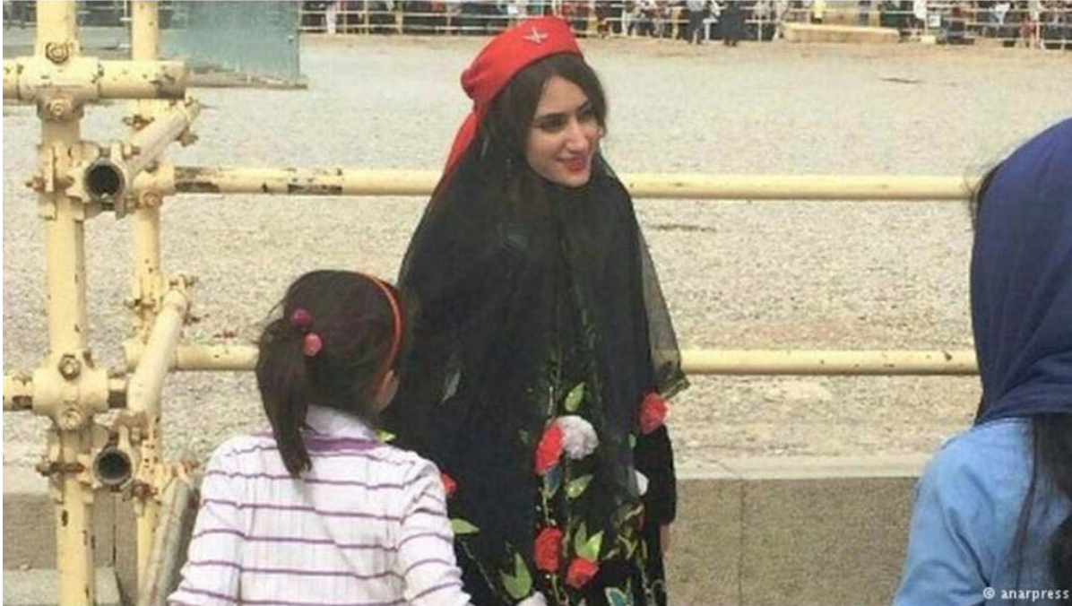
روایت تصویری از استقبال بی‌سابقه ایرانیان از مراسم بزرگداشت کوروش

به آنجا رسانده اند.. هیچ آرامگاهی تا به امروز، هیچگاه هرگز مکه که مدعی است خانه خدا است، یا مشهد یا کربلا چنین جمعیتی در یک زمان و خودجوش بدون هرگونه تبلیغ و نوحه خوانی و رجز خوانی بخود ندیده است.