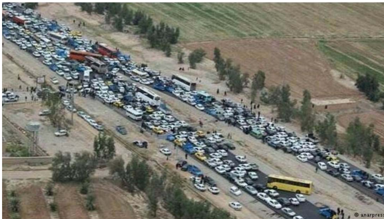
روایت تصویری از استقبال بی‌سابقه ایرانیان از مراسم بزرگداشت کوروش مراسم بزرگداشت روز کوروش کبیر در کنار آرامگاه کوروش در پاسارگاد